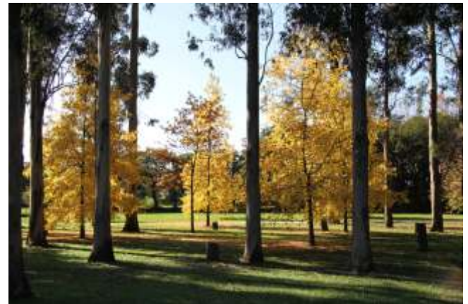
Outono no parque da Illa das Esculturas.

O mosteiro de San Bieito espéllase nun salón do Lérez. Os salóns son puntos do curso baixo do río nos que a canle se ensanxa e, grazas á influencia da marea, as augas se remansan.