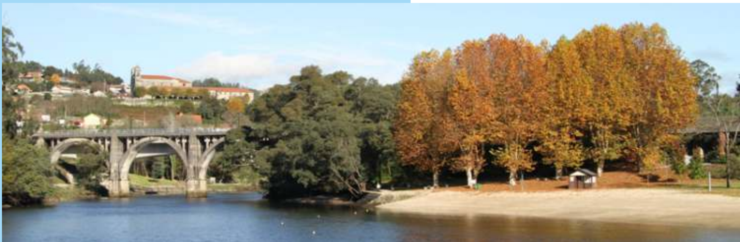
O río Lérez entrando na cidade de Pontevedra. Praia fluvial e pontes do tren.