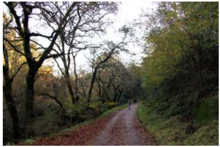
Senda do Lérez.