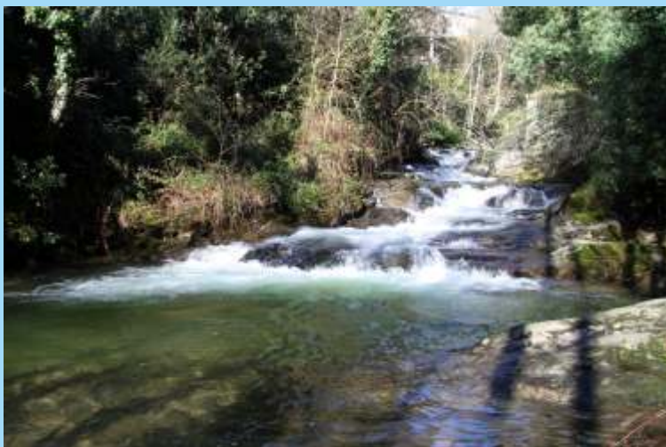
Rápidos no rego de Fontáns.