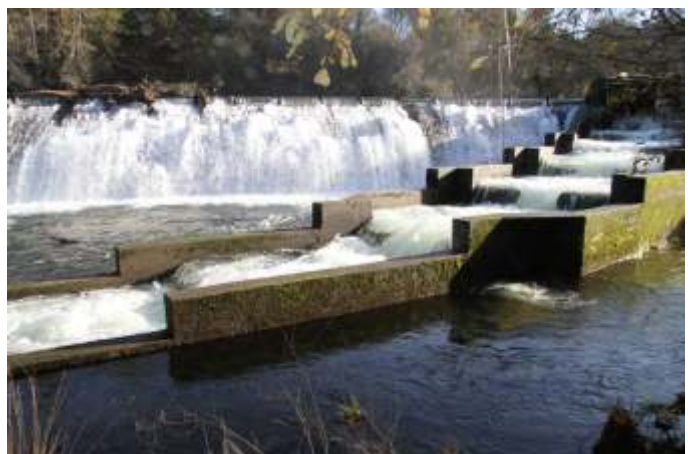
Remonte para peixes na presa de Bora.