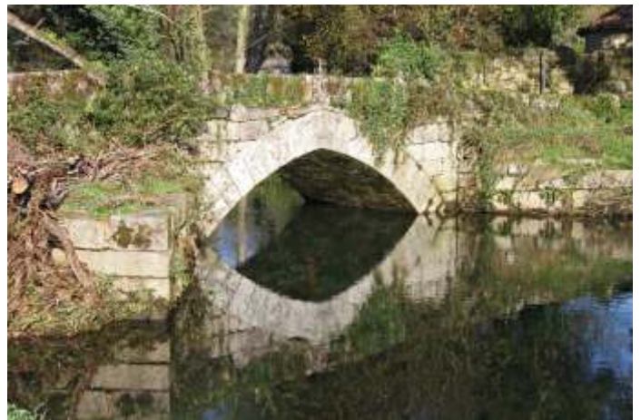
Ponte do Almofrei.