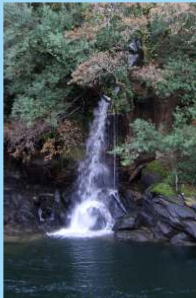
Fervenza no rego Fillagosa.

O Lérez nace na Serra do Candán e despois dun percorrido de 57 km desemboca na Ría de Pontevedra. O espazo protexido como LIC abrangre os últimos 20 km de percorrido do río desde Santa María de Sacos a Pontevedra. As augas do Lérez teñen unha gran riqueza biolóxica e as súas ribeiras conservan unha vexetación de gran interese e en bo estado de conservación.