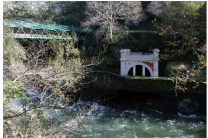
Fonte do antigo balneario do Lérez, fundado por Casimiro Gómez en 1904. Foi a cerna de Augas Lérez que se comercializaron en Arxentina e Gran Bretaña que segundo di a propaganda da época eran as máis radiactivas das analizadas ata o momento.